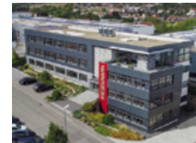
KIESELMANN Anlagenbau GmbH