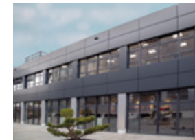
KIESELMANN Pharmatec GmbH