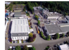
RIEGER Behälterbau GmbH