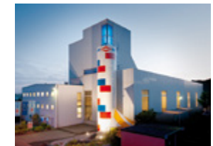
GROSS Behälterbau GmbH