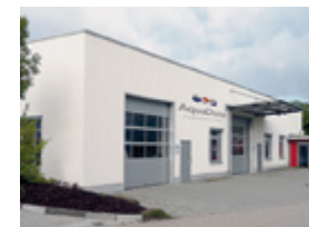
AquaDuna GmbH & Co. KG