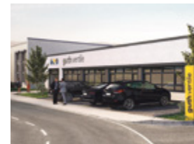
Guth Ventiltechnik GmbH