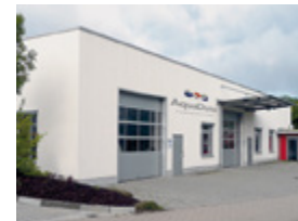
AquaDuna GmbH & Co. KG